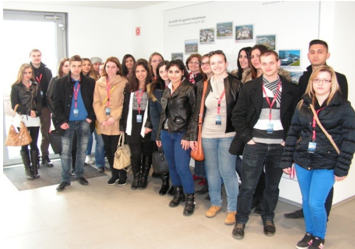
Audi Hungaria Factory