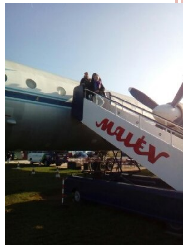
LISZT FERENC AIRPORT